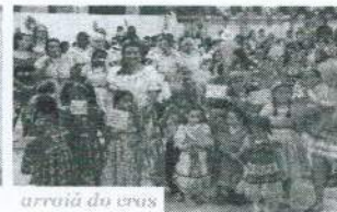
arraiá do eras