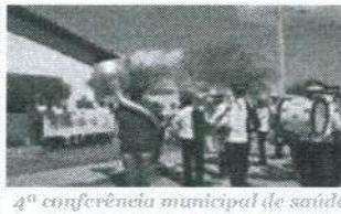
4ª conferência municipal de saúde 2015