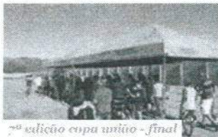
7ª edição copa uniuo - final