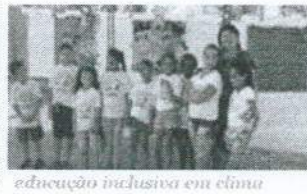
educação inclusiva em clima jovino