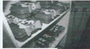
formatura abc 2014