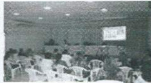
encontro pedagógico 2015