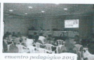
encontro pedagógico 2015