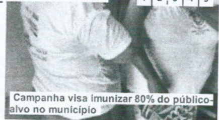
Campanha visa imunizar 80% do público-alvo no município