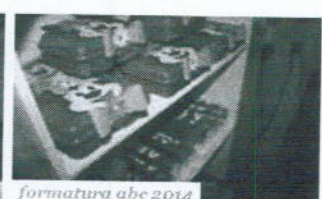
formatura abc 2014