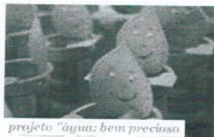
projeto "água: bem precioso"