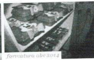
formativa abe 2014