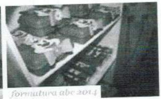
formatura abc 2014