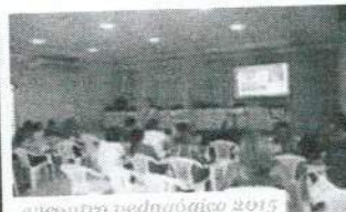
encontro pedagógico 2015