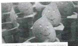
projeto "água: bem precioso"