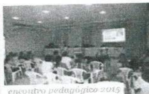
encontro pedagógico 2015