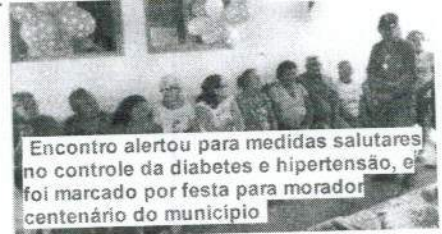
Encontro alertou para medidas salutaras no controle da diabetes e hipertensão, e foi marcado por festa para morador centenário do município