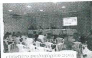
encontro pedagógico 2015