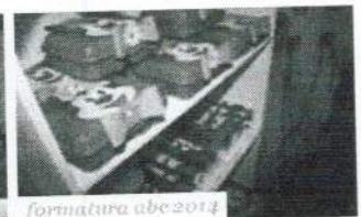
formatura abe 2014