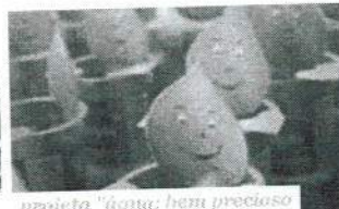
projeto "água: bem precioso"