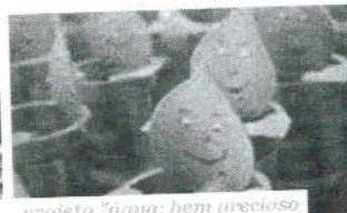
projeto "água: bem precioso"