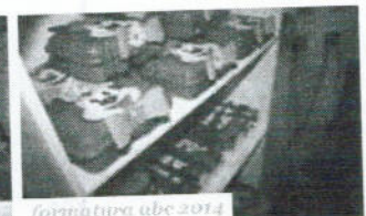
formatura ube 2014