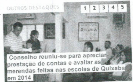
Conselho reuniu-se para apreciar prestação de contas e avaliar as merendas feitas nas escolas de Quixaba em 2014