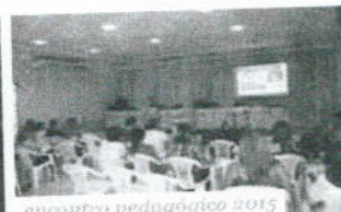
encontro pedagógico 2015