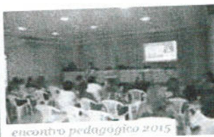
encontro pedagógico 2015