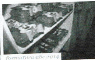
formatura abc 2014