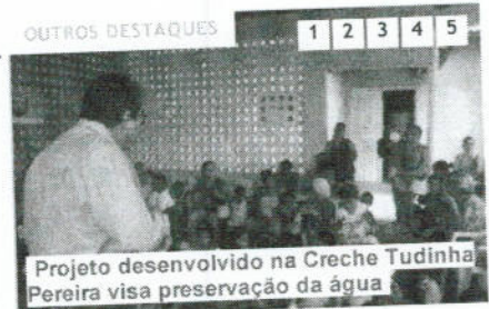
Projeto desenvolvido na Creche Tudinha Pereira visa preservação da água