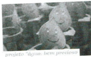
projeto "água: bem precioso"