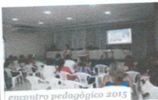
encontro pedagógico 2015