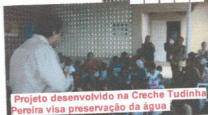
Projeto desenvolvido na Creche Tudinha Pereira visa preservação da água