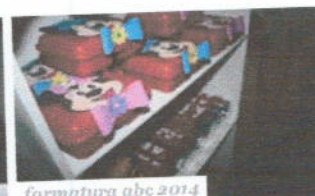
formatura abc 2014