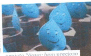
projeto "água: bem precioso"