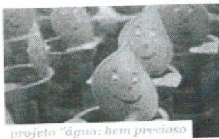
projeto "água: bem precioso"