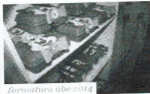
formatura abc 2014