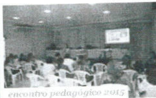
encontro pedagógico 2015