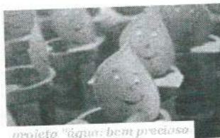
projeto água: bcm precioso