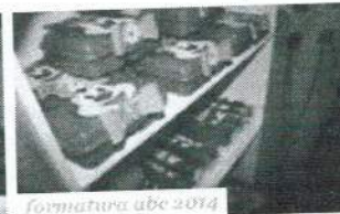
formatura abc 2014