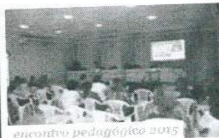
encontro pedagógico 2015