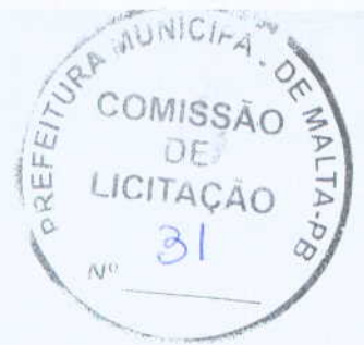
EDJA CONSULTORIA ASSESSORIA LTDA Assessoria Técnica